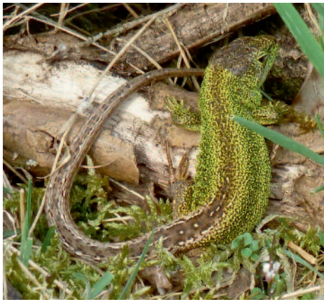
Prächtigt gefärbtes älteres Zauneidechsen-Männchen (2014 im 6. Kalenderjahr), dessen Zeichnung Ähnlichkeiten mit einer Smaragdeidechse aufweist

Schicht überformt. Der Wall, welcher schon im März/April 2014 zahlreiche Kleinsäugerbaue und möglicherweise von Echsen gegrabene Höhlungen aufwies, wurde ohne Hohlräume angelegt.