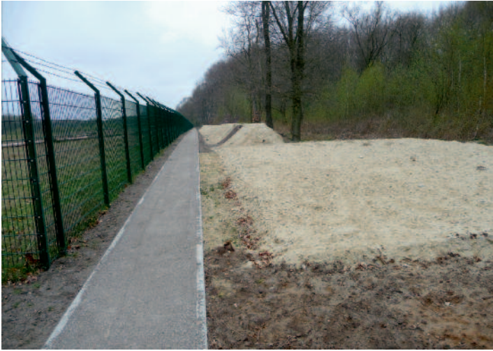
Erdwall und Eiablageplätze auf dem MZB-Gelände