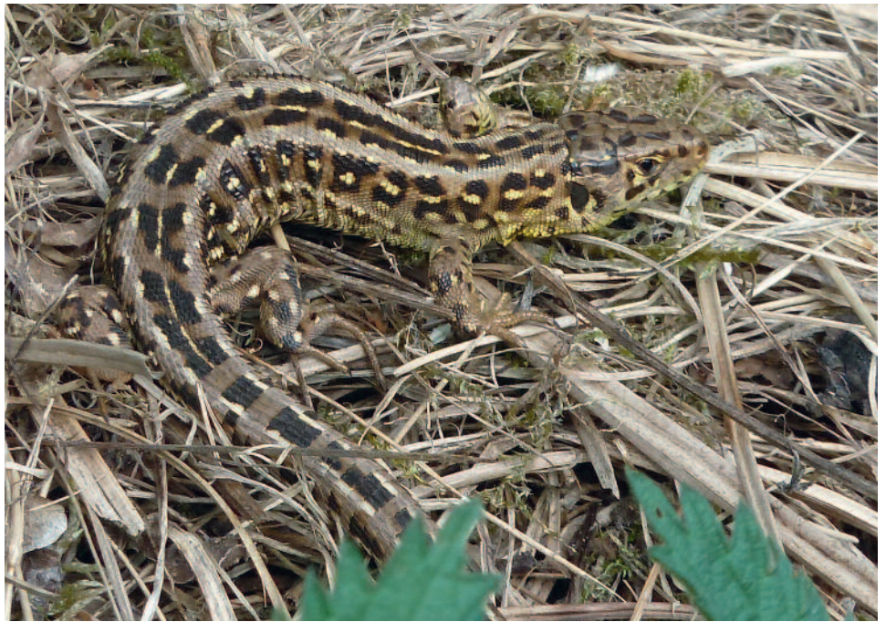
Adultes Weibchen der Zauneidechse kurz nach der Überwinterung

Insbesondere der Verbau/die Ablage von Baumstubben und Baumstämmen im beziehungsweise entlang des Zauneidechsen-Lebensraums haben zu einer Stabilisierung der dortigen Zauneidechsen-Population beigetragen.