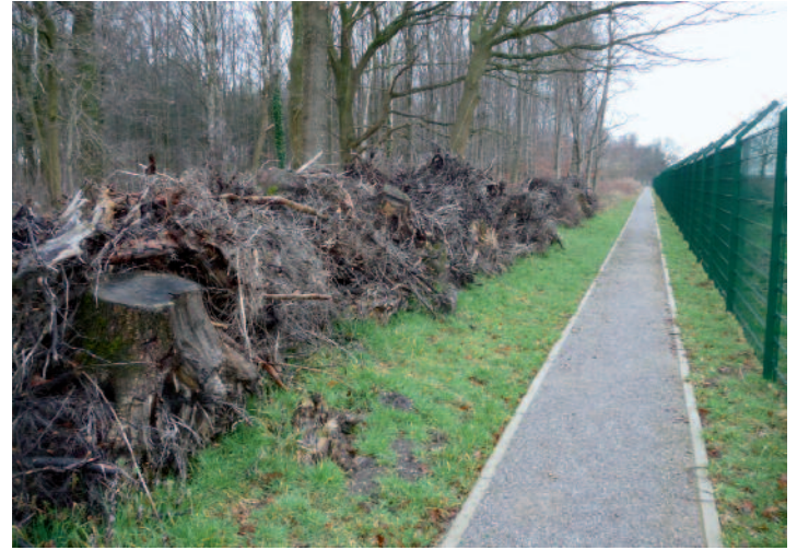
Baumstubben-Reihe auf dem MZB-Gelände