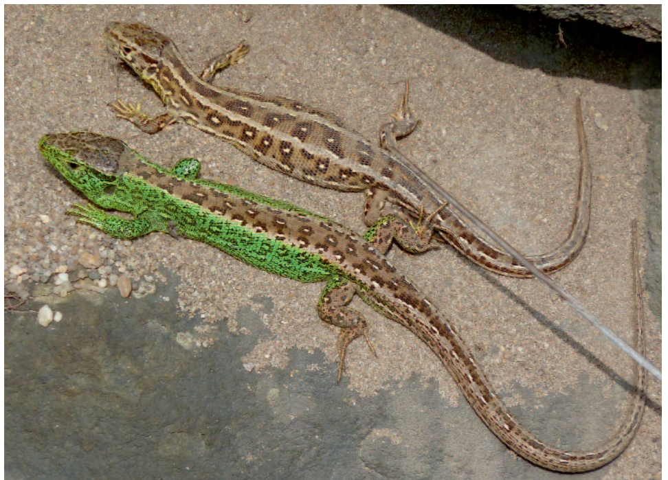
Ein Paar der Zauneidechse („Synchron-Pärchen“ im 3. Kalenderjahr) im jeweiligen Prachtkleid; die Unterschiede in Körperbau, Form und Färbung der beiden Geschlechter sind eindrucksvoll sichtbar